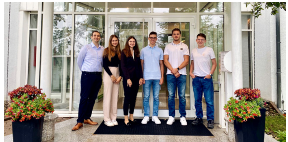
Unsere „Starter“ 2023

Die Ausbildung junger Menschen ist für die VR Smart Finanz nicht nur Ausdruck ihrer gesellschaftlichen Verantwortung, sondern auch ein wichtiger Weg, qualifizierten Nachwuchs selbst zu entwickeln. Seit über 25 Jahren bilden wir Nachwuchskräfte im Rahmen eines dualen Studiums an der DHBW Mannheim, als Auszubildende IHK oder im Rahmen eines Traineeprogramms aus. 2023 waren bei uns 13 dual Studierende und eine Auszubildende zur IHK Kauffrau Büromanagement beschäftigt.