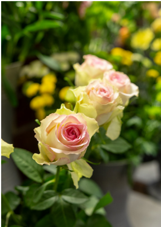
Frischblumen müssen gekühlt werden.